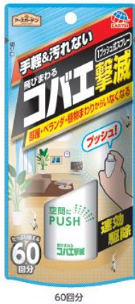
飛びまわるコバエ撃滅 1プッシュ式スプレー

アース製薬株式会社(本社:東京都千代田区、社長:川端克宜)は、家庭園芸用品「アースガーデン」シリーズから、室内のコバエ対策にコバエ撃滅シリーズ「飛びまわるコバエ撃滅 1プッシュ式スプレー」「土からわいたコバエ撃滅 粘着剤」を1月21日から発売いたします。