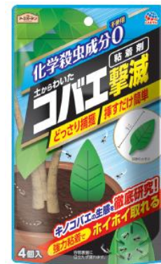
土からわいた コバエ撃滅 粘着剤

観葉植物を育てていて、虫に困っている人は、アブラムシに次いでコバエにも悩まされています(自社調査)。室内でよく見るコバエの代表的な種類は、ショウジョウバエ、キノコバエなどであり、コバエの特性に応じた対処が必要です。プッシュするだけで、飛びまわるコバエを速効駆除できる「飛びまわるコバエ撃滅」と土に挿すだけで、観葉植物の土から発生するコバエをどっさり取る「土からわいたコバエ撃滅」が効果を発揮します。