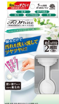
『フルーティーリーフの香り』

貼るタイプのトイレ用クリーナーは、使い捨てタイプが伸長傾向にあります。66%のお客様が「なくなるのが早い」と感じています。そこで1個で約2週間、1箱で約1ヵ月間、効果が持続するようにリニューアルしました。