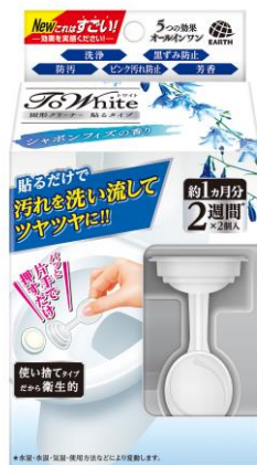
『シャボンフィズの香り』