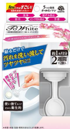
『フラワーパルフェの香り』