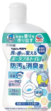
『ヘルパータスケ 良い香りに変える ポータブルトイレの防汚消臭液』

アース製薬株式会社（本社：東京都千代田区、社長：川端克宜）は、介護で頑張る方を応援する介護用品ブランド「ヘルパータスケ」から、使用中やお手入の際も、快適な香りと防汚効果を発揮するポータブルトイレ用消臭液『ヘルパータスケ 良い香りに変える ポータブルトイレの防汚消臭液』を2月20日に全国で発売いたします。