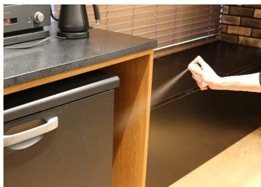
左『おすだけアースレッド 無煙プッシュ』、右：噴射イメージ