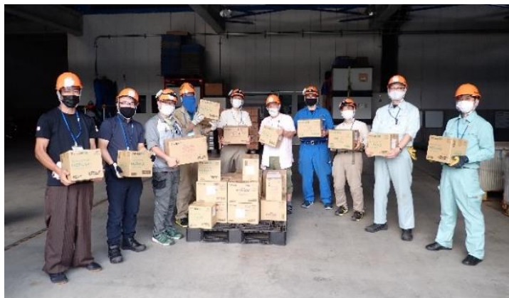
寄贈品を手にする第 63 次南極観測隊

アース製薬株式会社（本社：東京都千代田区、社長：川端克宜、以下「アース製薬」）は、第 63 次南極地域観測隊の心身の健康を支援するため、アルコールフリーでありながら、手指や全身のお肌をいたわり清潔に保つ、MA-T システム ® ※ 1 を採用した化粧水『Aqua Create Skin Solution（アクアクリエイト スキンソリューション）』などを、越冬隊 32 名に 1 年分寄贈いたしました。