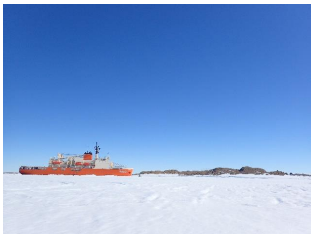
南極観測船「しらせ」

南極地域観測隊は、南極の気象や大気、地質、生物、雪氷、地殻変動などの観測を行うために、南極地域観測統合推進本部（本部長：文部科学大臣）によって毎年編成され、1956 年以来 60 年以上にわたり、地球環境の観測活動を続けています。