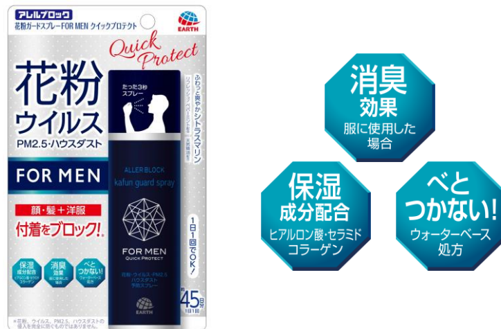
『アレルブロック 花粉ガードスプレー FOR MEN クイックプロテクト』

アース製薬株式会社（本社：東京都千代田区、社長：川端克宜）は、花粉対策製品「アレルブロック」シリーズに、男性向け花粉対策スプレー『アレルブロック 花粉ガードスプレー FOR MEN クイックプロテクト』を、12月20日より全国で追加新発売します。