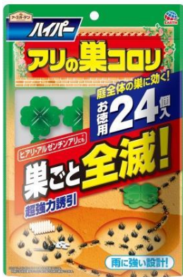
『ハイパーアリの巣コロリ』

アース製薬株式会社(本社:東京都千代田区、社長:川端克宜)は、家庭園芸用品「アースガーデン」シリーズから、大容量アリ用毒餌剤「ハイパーアリの巣コロリ 24個入」を1月21日から発売いたします。