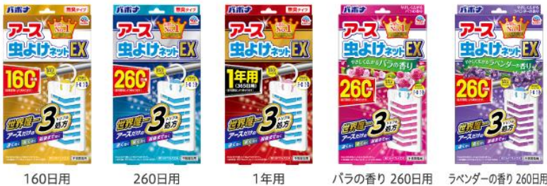
160日用 260日用 1年用 パラの香り 260日用 ラベンダーの香り 260日用