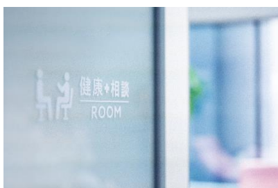
本社に設置された健康相談ルーム

本社では、健康相談ルーム、休養室や社員が休憩できるカフェの設置、坂越事業所（兵庫県赤穂市）では社員食堂を昨年リニューアルして健康に配慮した食事メニューを導入するなど、安心して健康に働くことができるオフィス整備にも力を入れています。その他、ヘルスリテラシー向上施策として、メンタルヘルスセミナー、女性の健康課題を知るセミナー、健診結果読み解きセミナー、禁煙セミナー、ストレッチセミナーなどの各種健康セミナーも継続して実施しました。インフルエンザワクチンの接種費用補助や職場での団体接種機会の提供、また禁煙に関する取り組みとしては、2024 年 1 月から全社敷地内・就業時間内禁煙もはじめています。