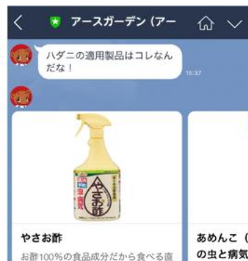
適用商品がすぐ分かる