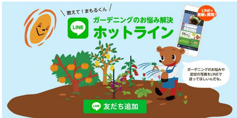
『サービス概要紹介ページTOPデザイン』

アース製薬株式会社（本社：東京都千代田区、社長：川端克宜）では、コミュニケーションアプリ「LINE」にて無料で園芸相談ができるサービス「ガーデニングのお悩み解決ホットライン」を本年3月1日に提供を開始して以来、ユーザー登録数が29000人を突破（6月1日現在）。園芸相談件数も、異例の月平均600件を超える結果となりました。