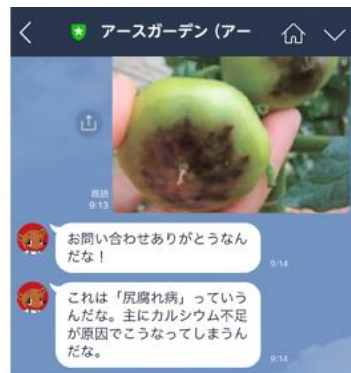
まもるくんからアドバイス