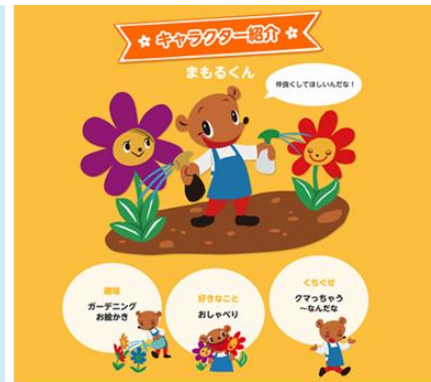
『アースガーデンキャラクター紹介』

「ガーデニングのお悩み解決ホットライン」は、アース製薬の園芸ブランド「アースガーデン」のLINE公式アカウントに友だち登録したユーザーが、ガーデニングに関するお悩みをテキスト・写真で相談すると、アースガーデンのキャラクターの「まもるくん」がお悩み解決に役立つアドバイスを無料で行うサービスです。