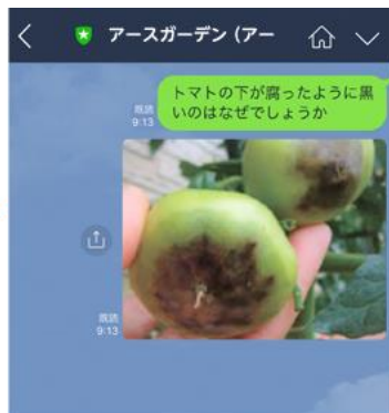
写真と相談内容を送信