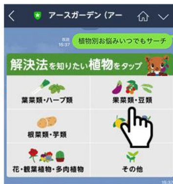
知りたい植物を選択する