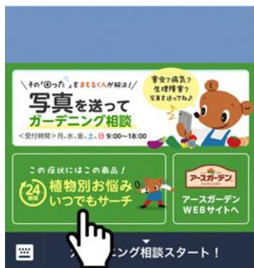
項目をタップする

※トマト・ピーマン・ナスなどをはじめ人気野菜 13種類が登録されています。今後も登録植物を続々追加予定。さらに進化していきます