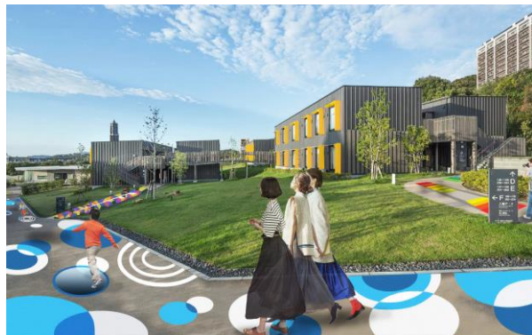
▲ペイントアートが施された各棟へ向かう通路