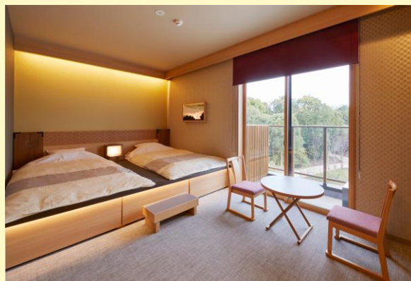
▲和室デラックスタイプ

客室は、7種類のタイプのお部屋をご用意しております。スーペリアタイプは、ご家族、ご友人グループでの滞在にもぴったりの、ゆとりある空間デザインで快適なホテルステイをお楽しみいただけます。また、ハウステンボスオフィシャルホテル唯一の和室のお部屋は、小さなお子さま連れに安心の添い寝ができるお部屋としてファミリーにご好評いただいております。