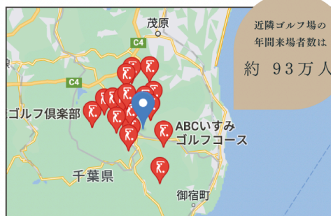
▲ゴルフ場数と年間来場者数（一季出版 調べ）