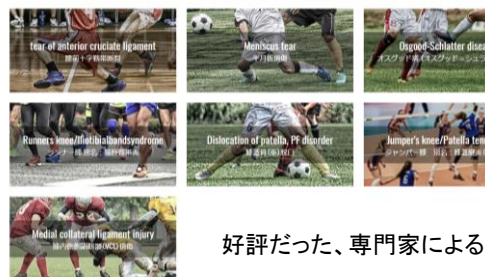
Sports Injury of Knee - ヒザのスポーツ傷害

この度、ザムストのブランドサイトを、真剣にスポーツをする姿をメインビジュアルとして配置することで、「より力強く、よりスポーティに」リニューアルいたしました。ケガに対するリスクや不安をサポートすることで、アスリートの挑戦を支えていくブランドのウェブサイトとして、今後も新商品情報をはじめ、ケガのケアやトレーニングについての情報なども掲載していき、多くのアスリートが来訪するサイトに生まれ変わります。