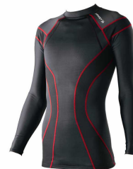
Z-20 トレーニングシャツ ブラック×レッド(男性用)

( 詳細はザムストオフィシャルホームページをご確認ください。: http://www.zamst.jp/ )