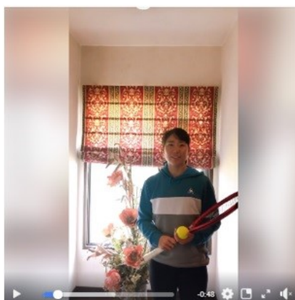
テニス 日比野菜緒選手