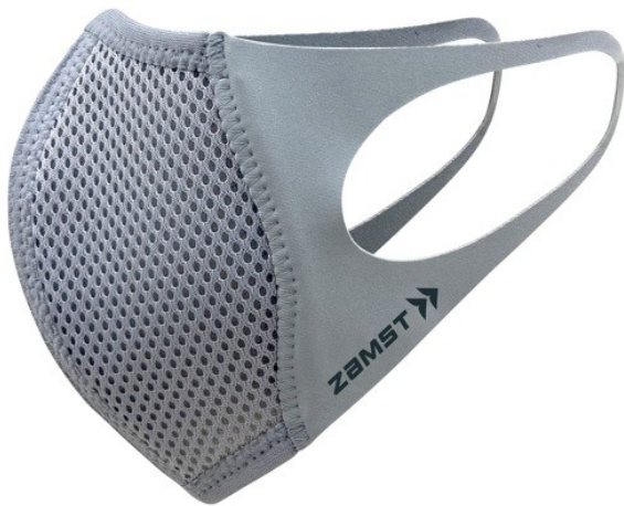
新色 ライトグレー