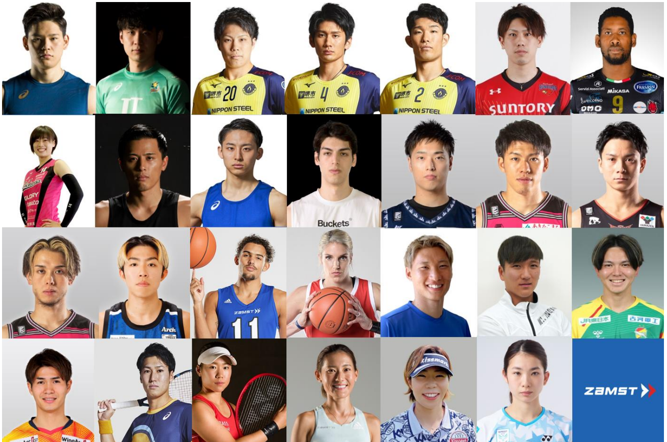
バレーボール: 西田有志、小野寺太志、山本智大、高野直哉、樋口裕希、大宅真樹、ウィルフレド・レオン、佐々木千紘/ バスケットボール: 富樫勇樹、河村勇輝、シェーファー アヴィ 幸樹、岡田侑大、保岡龍斗、津屋一球、伊藤駿、寺嶋恭之介、トレイ・ヤング、エレナ・デレ・ダン/ サッカー: 畠中稔之輔、鶴木郁哉、小林祐介、佐藤亮/ テニス: 綿貫陽介、日比野菜緒/ マラソン: 岩出玲亜/ ゴルフ: 穴井詩/ バドミントン: 松友美佐紀 他アスリート・チーム多数

ZAMSTはバレーボール、バスケットボール、サッカー、テニス、マラソン、ゴルフ、バドミントン、など、あらゆるスポーツにおいて限界に挑み続けるアスリートや団体を応援しています。