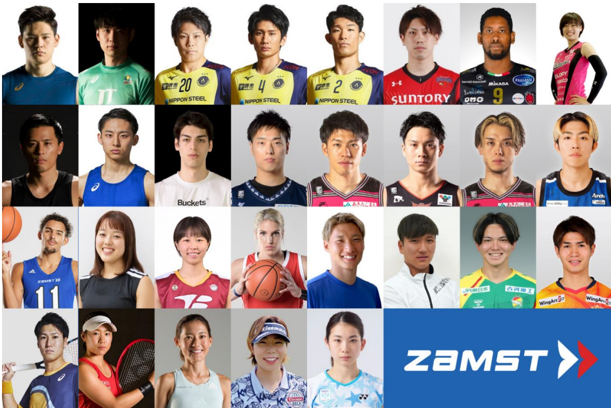
バレーボール: 西田有志、小野寺太志、山本智大、高野直哉、樋口裕希、大宅真樹、ウィルフレド・レオン、佐々木千紘/ バスケットボール: 富樫勇樹、河村勇輝、シェーファー アヴィ 幸樹、岡田侑大、保岡龍斗、津屋一球、伊藤駿、寺嶋恭之介、トレイ・ヤング、山本麻衣、東藤なな子、エレナ・デレ・ダン／サッカー: 畠中楨之輔、鶴木郁哉、小林祐介、佐藤亮／テニス: 綿貫陽介、日比野菜緒／マラソン: 岩出玲亜／ゴルフ: 穴井詩／バドミントン: 松友美佐紀 他アスリート・チーム多数

ZAMST はバレーボール、バスケットボール、サッカー、テニス、マラソン、ゴルフ、バドミントン、など、あらゆるスポーツにおいて限界に挑み続けるアスリートや団体を応援しています。