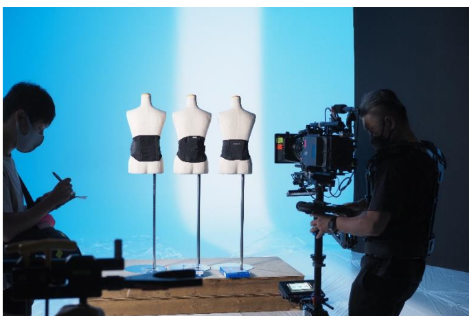
▲日本シグマックスを代表する腰サポーターたち