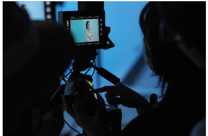
▲スタッフの方による撮影データ確認タイム