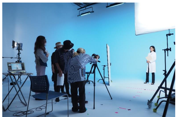
▲撮影中多くのスタッフに見守られる黒谷さん