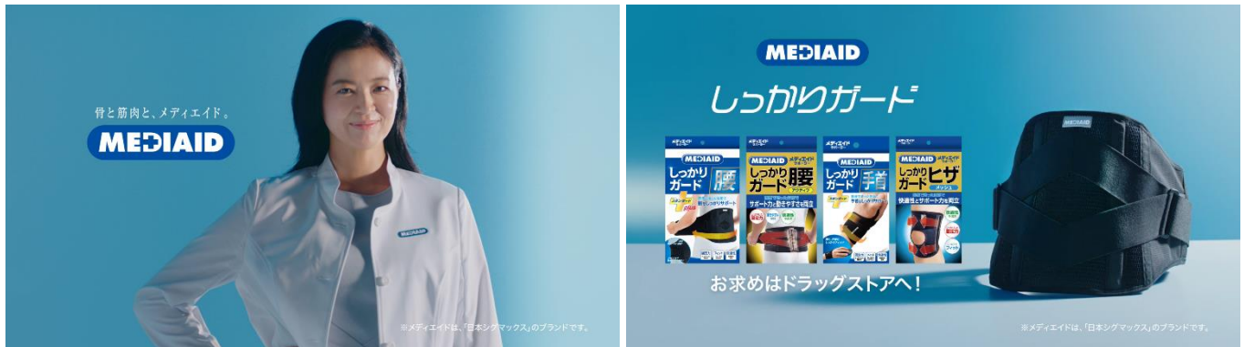
▲MEDIAID としては「スタイルケア」シリーズに続く第3弾 CM