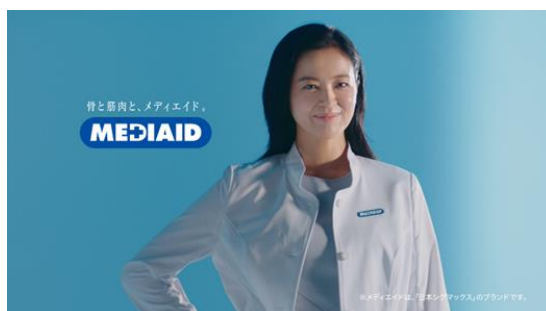
▲MEDIAID ブランドアンバサダー 黒谷友香さん