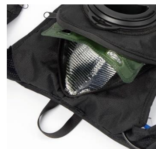
▲タンク内装は保冷バッグ仕様