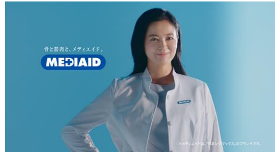
▲MEDIAID ブランドアンバサダー 黒谷友香さん