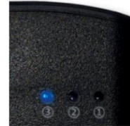
③長時間使用モード