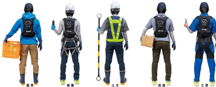
▲業種別装着イメージ