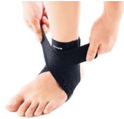
▲新たに発売する「メディアイド しっかりガード 足首 テーピングプラス」