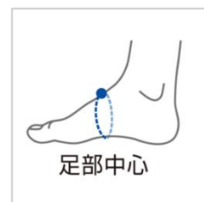
▲サイズ計測位置について