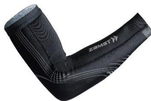
▲ザムスト プレシオーネ アーム