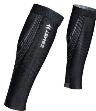
▲ザムスト プレシオーネ カーフ