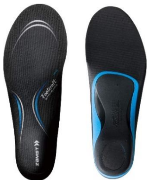
▲ザムスト Footcraft STANDARD

ザムストではブランドのルーツである関節用サポーターをランニング用に最適化した「RK シリーズ」、筋肉の疲労軽減をサポートする「コンプレッションアイテム」、足裏をサポートする「機能性ソックス」・「機能性インソール」など豊富にラインアップ。レースの完走、レコードの更新に果敢に挑戦するランナーを応援し、サポートします。