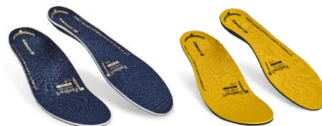
▲新たに発売する Footcraft CUSTOM BALANCE(左)、IMPACT(右)

「BALANCE(バランス)」、「IMPACT(インパクト)」の2製品を2024年7月18日(木)より新たに発売いたします。