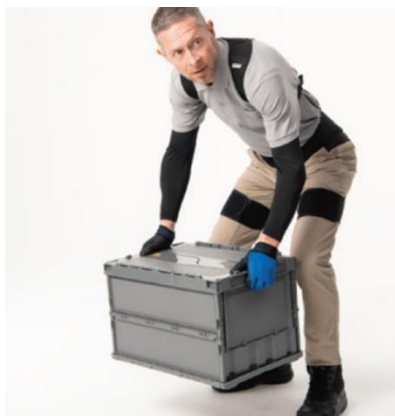
▲持ち上げ姿勢をサポート