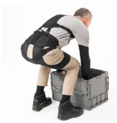
▲前傾姿勢をサポート

着用時のかさばりや重さを最大限廃し、体にしっかりフィットしつつ作業中の身体の負担を効率的に軽減。筋肉・関節への負担を軽減するために用いるのは各種の伸縮素材。それらを体の動きに合わせて適切な位置に配置し、なおかつ動作によるずれを防ぐために、当社のサポーター開発で蓄積したノウハウをふんだんに盛り込みました。