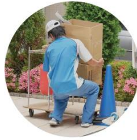
重量物の持ち上げ