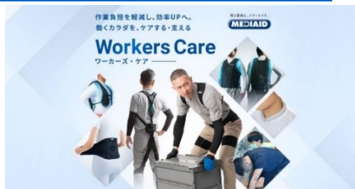
▲メディエイドより展開するワーカーズ・ケア事業

各関節サポーターやアシストスーツ、暑熱対策アイテムといった製品や、企業向け腰痛対策サービスの実施を通して、労働安全衛生面での課題解決や、従業員の満足度向上、健康経営®のサポートに貢献してまいります。