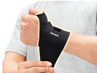
▲新たに発売する、メディエイドサポーター しっかりガード 手首 スリムハードプラス