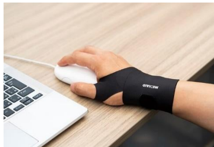
▲デスクワーク時に