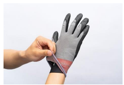
▲グローブの下に装着可能