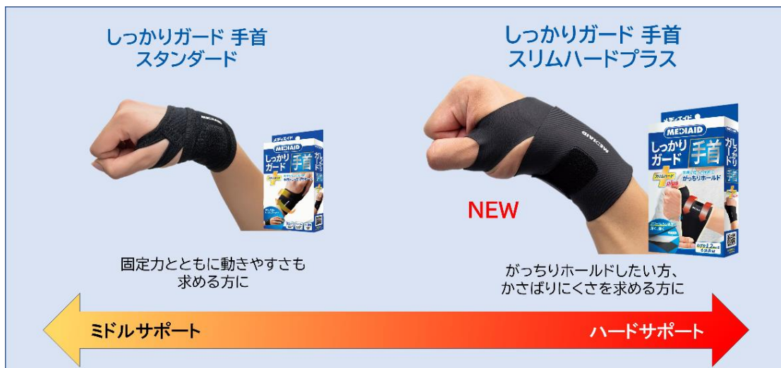
▲メディエイドの手首サポーター 比較表

これまででもメディエイドでは手首サポーターを展開してまいりました。その中で、「固定力には満足しているが、もう少し手首全体を覆ってサポートしてほしい」、「フリーサイズで使えるサポーターが欲しい」といったお声を頂き、ご要望にお応えすべく、この度、「メディエイド しっかりガード 手首 スリムハードプラス」を新たにラインアップする運びとなりました。