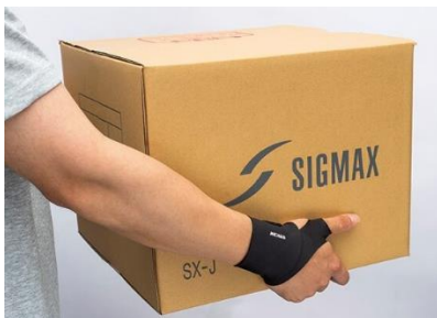
▲重労働・軽作業時に