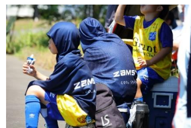
▲2024年度の累計出荷数量は4.8万枚超え。スポーツ時や観戦時など様々なシーンで活躍