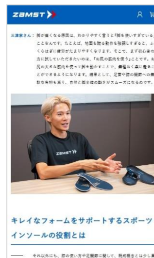
▲インタビュー記事も充実

https://www.zamst-online.jp/brand/insole/47896/