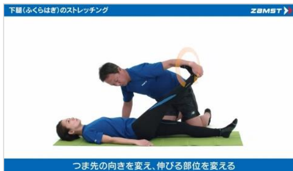
▲ストレッチなどは動画でわかりやすく解説

https://www.zamst-online.jp/brand/supporter/48654/