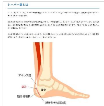
▲身体の仕組みや痛みの場所は図解も活用

https://www.zamst-online.jp/brand/supporter/47984/