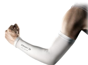
▲「ザムスト アームスリーブ COOL EDITION」 白色を新発売

ザムストオンラインショップで予約販売を4月21日(月)より開始、全国のザムスト製品取扱店での販売は5月中旬より開始します。