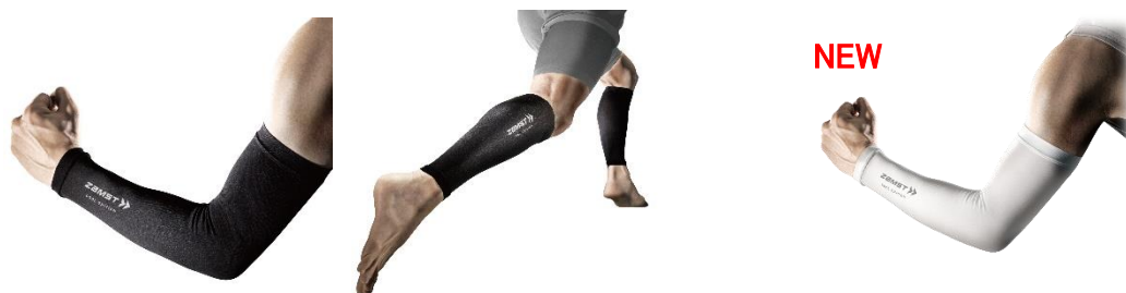
▲アームスリーブ/カーフスリーブ COOL EDITION(左・中央)とアームスリーブ COOL EDITION 白色(右)

製品を販売する中で、お客さまから「白色など淡いカラーのアームスリーブもラインアップしてほしい」といったご要望を頂いておりました。そこで、今年は、太陽などの光を反射し温度が上昇しにくい白色を追加して、新たに発売する運びとなりました。