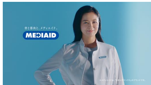
▲MEDIAID ブランドアンバサダー 黒谷友香さん