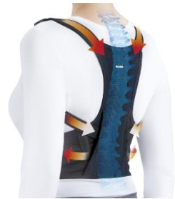
▲「メディエイド スタイルケア 姿勢リフォーム」を 2 月 16 日より新発売