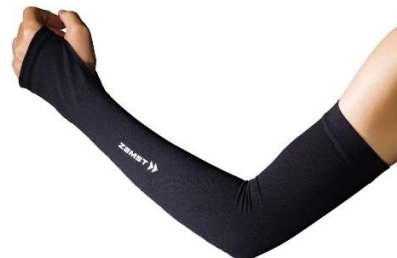
▲新たに発売する 「ザムスト アームスリーブ ロング COOL EDITION」

スポーツ向けサポート・ケア製品ブランド「ZAMST(ザムスト)」を展開する、日本シグマックス株式会社(本社:東京都新宿区、代表取締役社長:鈴木 洋輔)は、持続冷感に特化した「ザムスト アームスリーブ COOL EDITION」に手の甲までカバーし、UV 対策範囲をさらに拡大したアイテム「ザムスト アームスリーブ ロング COOL EDITION」を、4月14日(火)より新たに発売いたします。