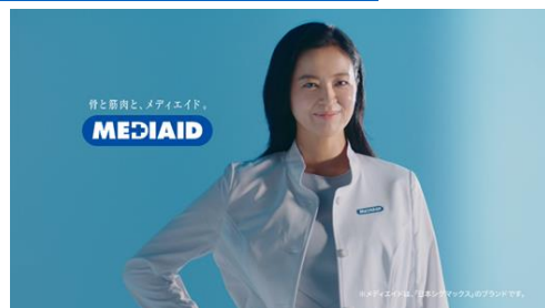
▲MEDIAID ブランドアンバサダー 黒谷友香さん