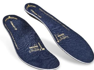
▲ Footcraft CUSTOM BALANCE