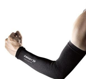
▲ ザムスト アームスリーブ COOL EDITION