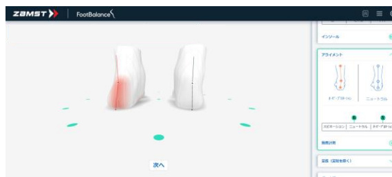
▲分析結果画面のイメージ