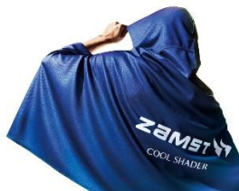
▲ ザムスト COOL SHADER