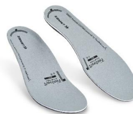
▲ Footcraft CUSTOM GRIP