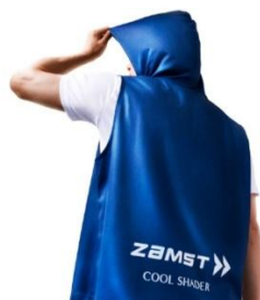
▲ ザムスト COOL SHADER アクティブベスト