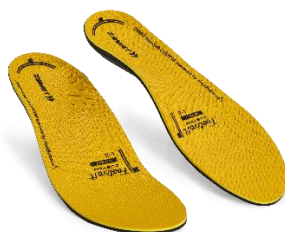
▲ Footcraft CUSTOM IMPACT