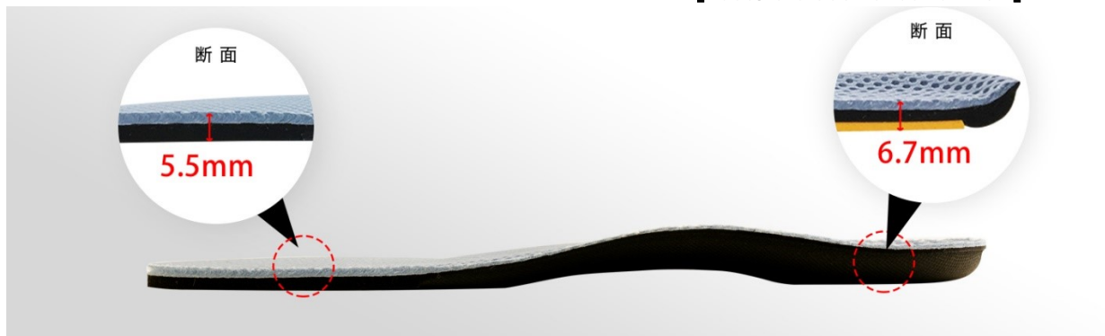
[Footcraft Cushioned for RUN]