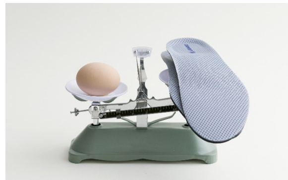
[Footcraft Cushioned for RUN]