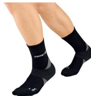
ザムスト HA-1 レギュラー