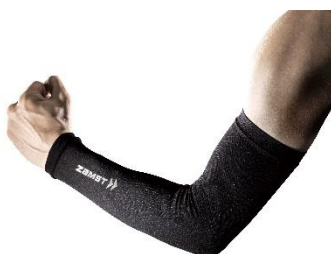
ザムスト アームスリーブ