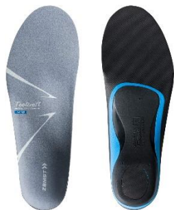
ザムスト Footcraft AGILITY GRIP