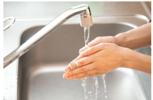
▲水に濡れても使用できるため衛生的

また、テーピングによる固定では、水仕事をする度に濡れてしまうため巻き直しが必要ですが、「ヘバーデンリング」は水に濡れても使用し続けられます。そのまま手洗いもでき、また錫は優れた抗菌性を持った素材であるため、衛生的に使用することができます。