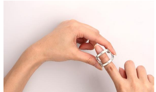
▲錫は柔らかく、指に合わせて調整可能