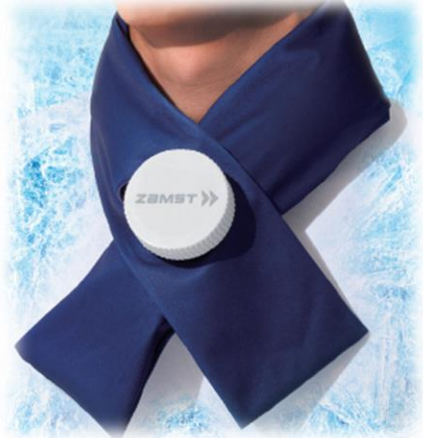
▲「ザムスト アイスバッグ 首用」を新発売

2024年4月1日(月)よりザムストオンラインショップで予約販売を開始し、全国のザムスト製品取扱店での販売は5月下旬ごろから開始します。