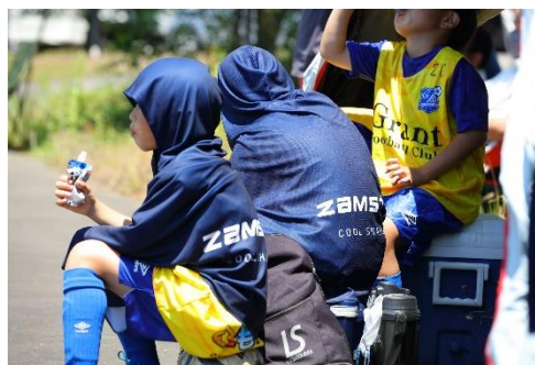
▲2023年度の累計出荷数量は13,000枚超え。スポーツ時や観戦時など様々なシーンで活用