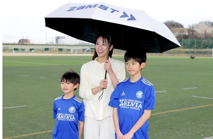
▲新たに発売する「ザムスト WIDE SUNSHADER」

2024年4月1日(月)よりザムストオンラインショップで予約販売を開始し、全国のザムスト製品取扱店での販売は5月上旬より開始します。