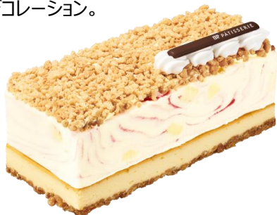
サイズ：縦 約6.5cm×横 約15cm×高さ 約5.6cm

サーティワン自慢のチーズケーキフレーバー、甘酸っぱい「ストロベリーチーズケーキ」にバイクドチーズケーキと、ザクザク食感のクランチを合わせて、ホイップクリームとチョコレートでデコレーション。