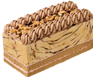
サイズ：縦 約6.5cm×横 約15cm×高さ 約5.8cm

2種の豆をドリップしたコーヒーが香る「ジャモカアーモンドファッジ」にコーヒーケーキを重ね、チョコレートホイップクリームにソース、さらに香ばしいローストアーモンドをデコレーション。