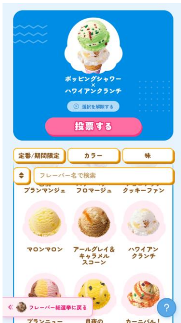
ダブル総選挙 フレーバー選択画面

投票は期間中毎日1回可能です。選挙公約として、オリジナルデザイングッズのプレゼントや、期間限定フレーバーの復刻も予定しています。また投票していただいた方には抽選で、「サーティワン貸し切り食べ放題イベント」があたります！あなたの“推しフレーバー”や“お気に入りダブル”に、ぜひ毎日1回投票してください。注目の投票結果は、5月9日（土）アイスクリームの日に発表いたします。