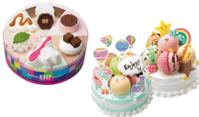
パレット6セレクション(左):【5号】直径約16cm×高さ約5cm 31デコケーキ(右):【4号】直径約14cm×高さ4.5cm +お好きなポップスcoop6個