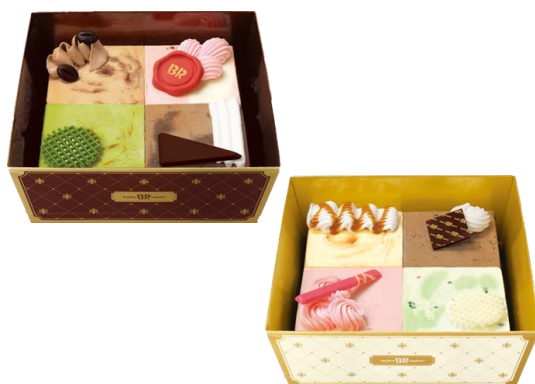
プティケーキ(ブラウン/ホワイト): 全体(容器を除く):縦 12cm×横 12cm×高さ 2.5cm

サーティワンでは、上半期のアイスクリームケーキ販売数がコロナ禍前の2019年以降、4年連続前年超えを達成しており、 アイスクリームケーキの需要が伸びてきております。更に！一部店舗でテスト販売し、プティケーキを購入したお客様にアンケートを 実施した結果、「かわいい」「サイズがちょうどいい」などのご回答をいただきお客様の満足度は 89% という結果となりました。 この結果から、プティケーキを発売することで、より多くのお客様にアイスクリームケーキを楽しんでいただけます。