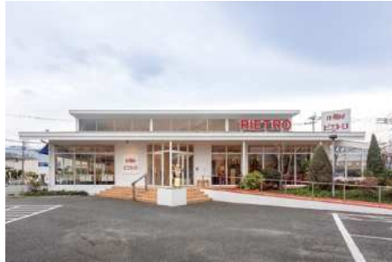
ピエトロ 次郎丸店 (福岡県福岡市早良区)