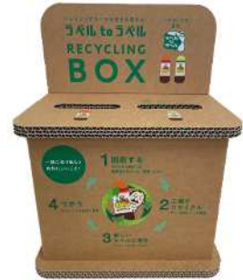
ラベル回収ボックス