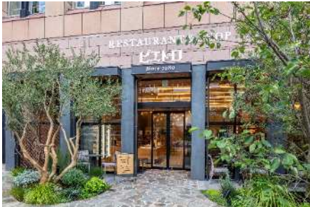
ピエトロ本店 セントラーレ (福岡県福岡市中央区)

2024年6月5日(水)から、ピエトロレストラン2店舗のレジ横に専用の回収ボックスを設置し、使用済みのラベルを回収いたします。