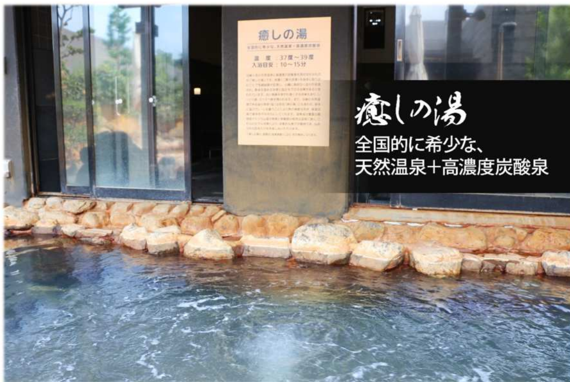
全国的に希少な天然温泉に高濃度炭酸泉を混ぜ合わせた「癒しの湯」

キャンペーン期間中には、お得なキャンペーンが目白押しです。今月のおすすめは、夏バテ気味なからだの回復に効果的な「癒しの湯」です。この機会に「湯の華廊」で、大阪層群地下1,001mから湧き出る源泉かけ流しの天然温泉をご堪能ください。