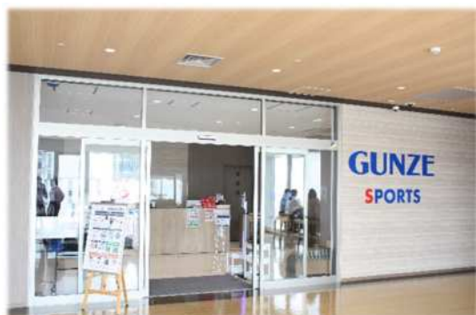
グンゼスポーツ吹田健都店外観