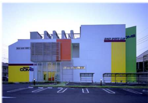
グンゼスポーツスカイガーデン店外観