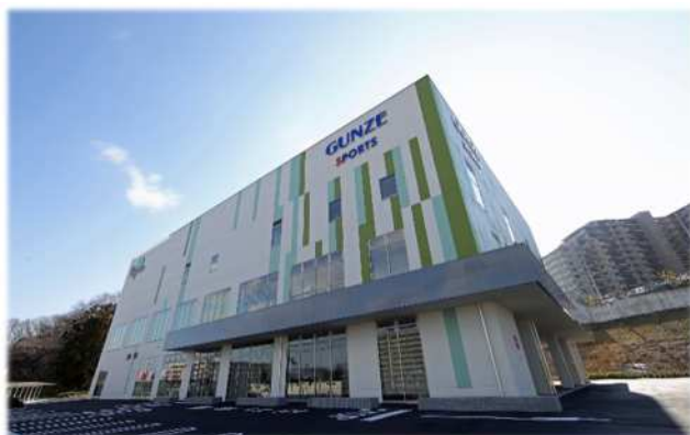
Gunzeスポーツ吹田ミリカ店外観