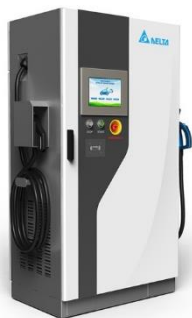
50kW 急速充電器 「DCJ503」シリーズ