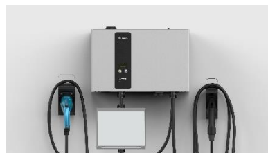
25kW DC 充電器 「EVDJ25」シリーズ