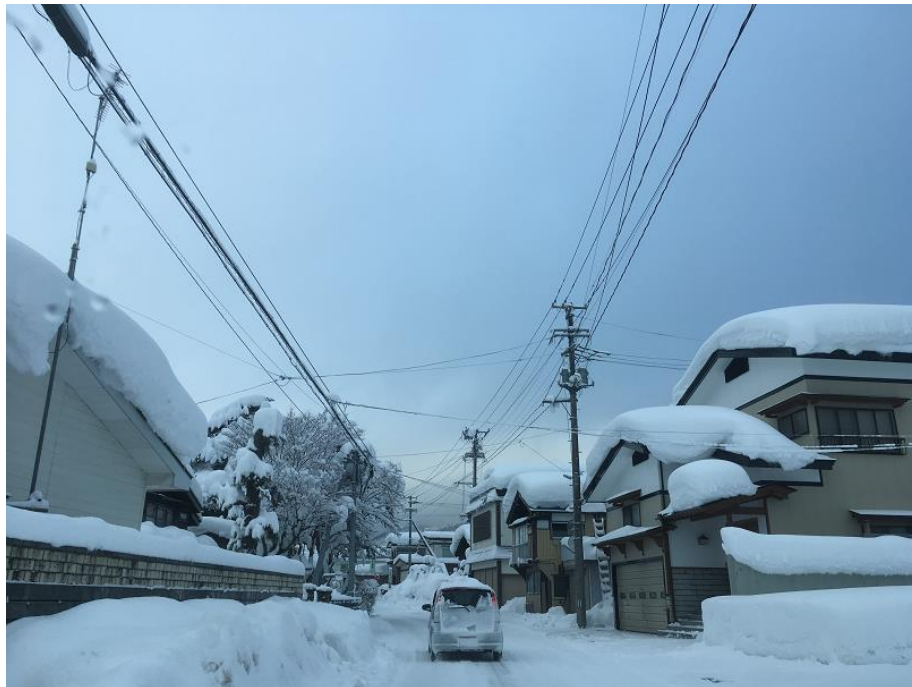
積雪4M 地域イメージ写真（実際の長野県飯山市山間部の写真ではありません。）