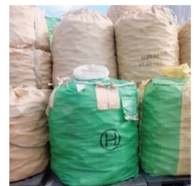
回収されたカートリッジ

回収された浄水カートリッジはまず高知県南国市のリサイクル工場に運ばれます。1週間で約6,000本が届きます。(中にはお礼状や子供たちからのメッセージなども添えられて返送されるケースもあります。)