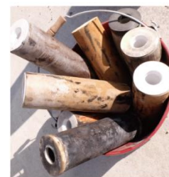
汚れがひどいものも