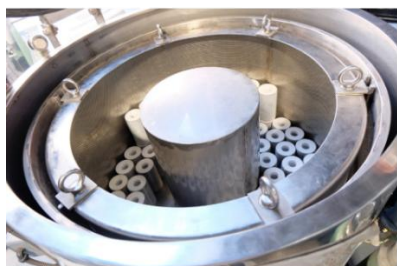
遠心分離機に入ったフィルター

フィルターの中にはまだ水分が残っているので、遠心分離機を使って、中の水分を飛ばします。さらに、完全に水分を取りきるため、乾燥専用のユニットハウスに2~3日寝かせます。