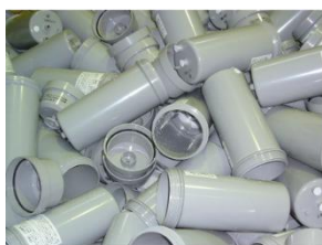
プラスチックケース