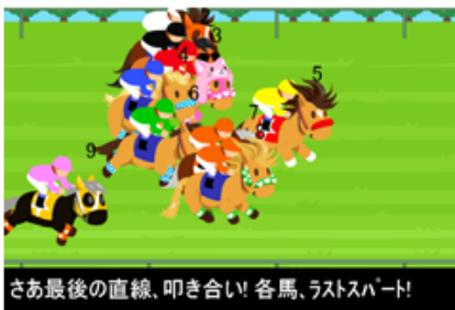
“レース”に出走して賞金ゲット！