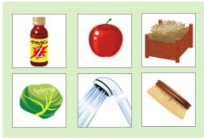
さまざまな“お世話アイテム”