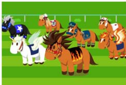
たくさんの“うまアバター”

様々なランキングや重賞コンプリートを用意。また、“うまアバター”は定期的にアイテムを追加していく他、よりユーザー間で盛り上がる様な機能追加やイベントを実施します。