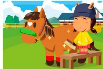
“お世話”で愛馬の体調管理