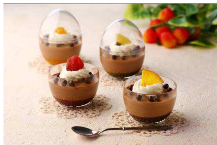
ヴェリーヌ ド ショコラ