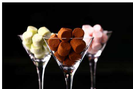
カクテルガナッシュ

他にも、季節ごとに新しい味わいが楽しめる「ボンボンショコラ」や、カクテルをイメージした華やかな香りのガナッシュ「カクテルガナッシュ」、素材とチョコレートのマリアージュが絶妙な「チョコレートコレクション」など、グランスタ限定のオリジナル商品が揃っています。店舗名はフランス語で「チョコレートの市場」という意味の「マルシェ ド ショコラ」。その名の通り、チョコレートを使ったスイーツがまるで市場のように賑やかに並びます。おしゃれなスイーツパーティーに最適な商品、静かな夜にひとりで楽しむショコラも揃え、お客様の様々なシーンに合わせて、チョコレートで彩るデイリーハピネスをご提案いたします。